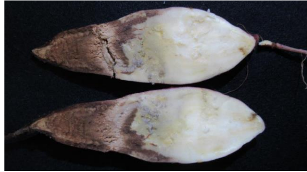
図2 塊根の断面（左が成り首側）